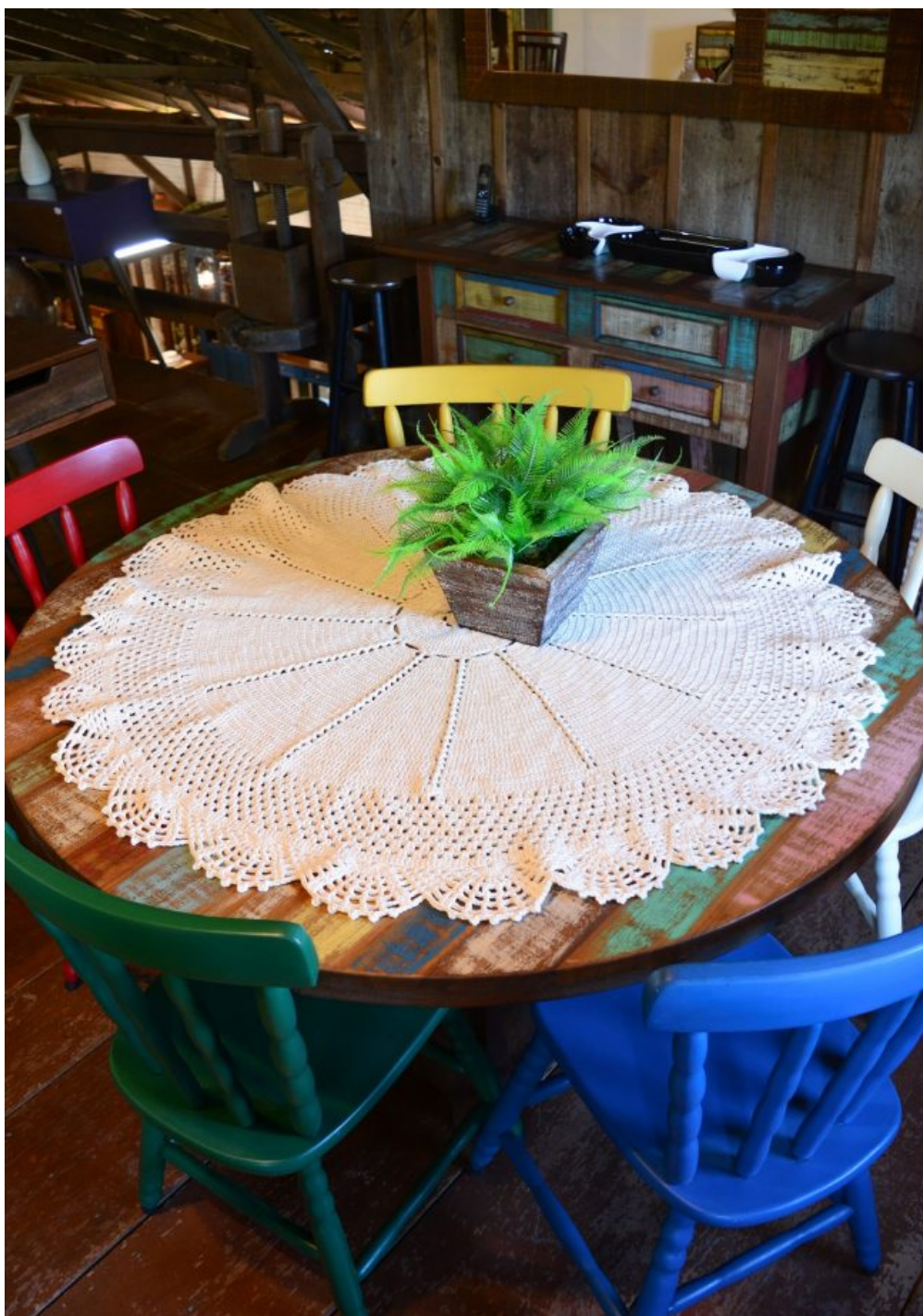
Centro de Mesa Redondo Nice