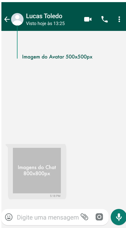
Imagem do Avatar 500x500px