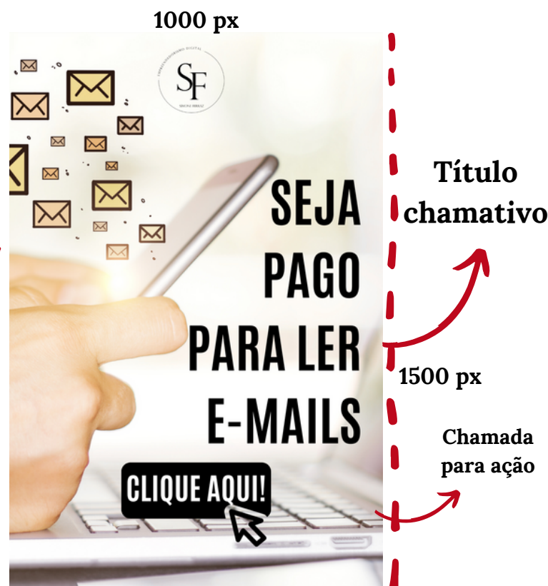
imagem de alta qualidade