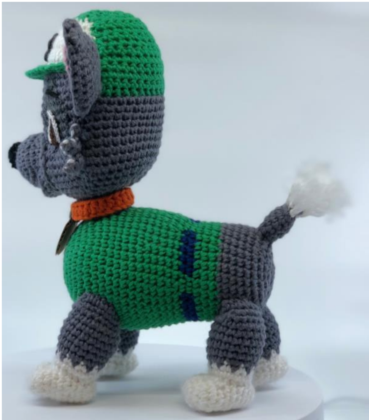
Figuras dos símbolos dos colarinhos.