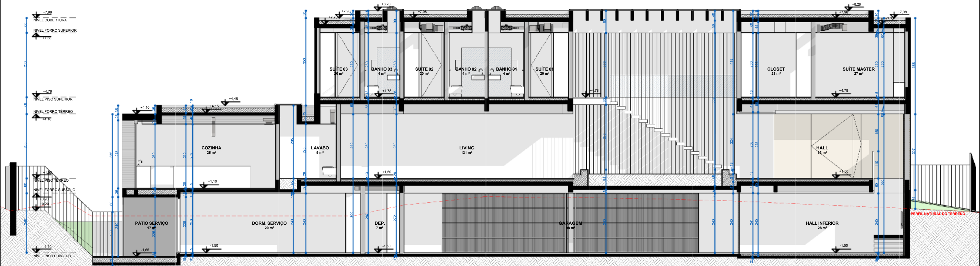
01 CORTE EE' | ESCALA 1 : 50