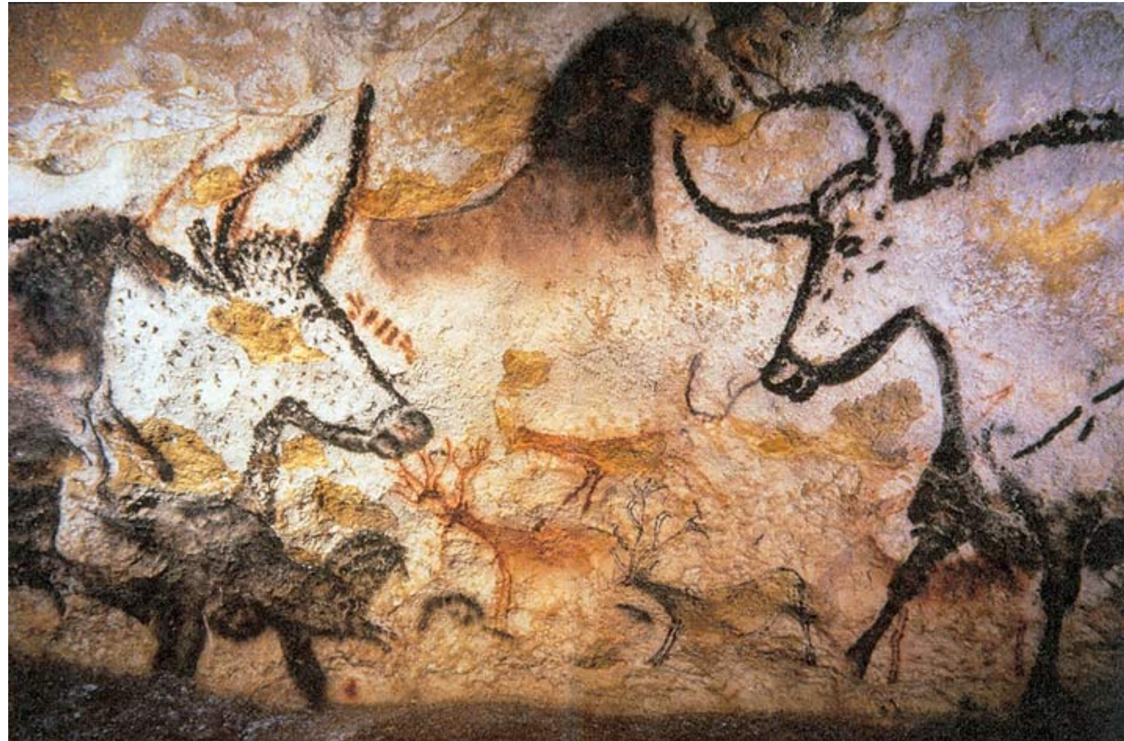
cavernas de Lascaux, desenhos feitos há mais de 15 mil anos, imagem: Prof saxx - domínio público

Nas cavernas de Lascaux, complexo de cavernas ao sudoeste da França , foram descobertos na década de 40 desenhos feitos há mais de 15 mil anos, ou seja, desde os primórdios da civilização as pessoas já buscavam contar sua história, imprimir sua marca e demarcar seu espaço por meio de pintura nas paredes das cavernas. As figuras não se repetem, o que expressa nosso impulso ancestral de nos diferenciar dos demais, personificar ambientes e comunicar algo ao grupo social, decorando o lugar onde vivemos.