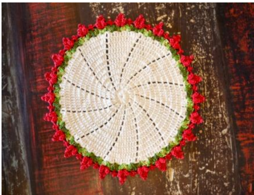
Sousplat Cru Com Borda Verde E Vermelho