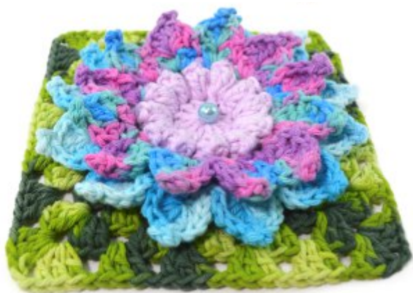
Criação: Luana Jaworski