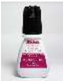
COLA GLUE BLACK PREMIUM

Agora com uma cartela de fios e a cola você irá treinar, o mapeamento e direcionamento dos fios.