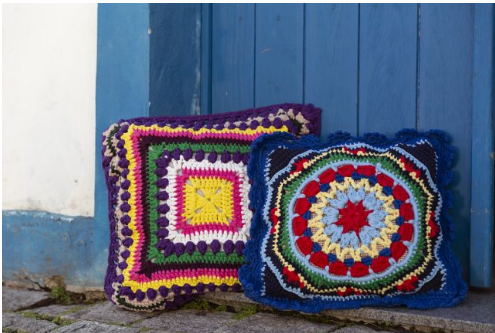
Almofada Trama Pontos Pipoca