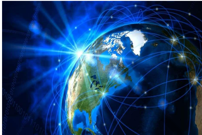
Figura 1.4 – Ilustração sobre Internet, utilizando recursos da computação quântica