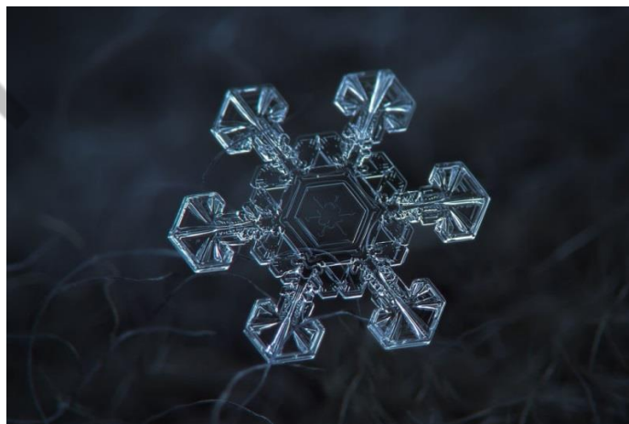
Figura 1.3 – Fractal de um floco de neve