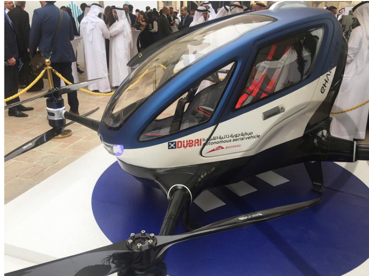
Figura 1.5 – Drone Ehang 184 sendo apresentado em Dubai

A Ford anunciou que lançará sua primeira frota de carros autônomos em 2021, e, em 2017, o fabricante chinês de drones Ehang começou a operar seu táxi aéreo sem piloto para trafegar pelos céus de Dubai.