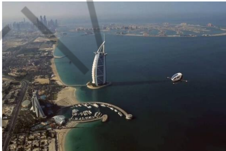
Figura 1.6 – Perspectiva do Drone Ehang 184 sobrevoando Dubai

Os grandes centros médicos no mundo estão cada vez mais recheados de equipamentos e sistemas inteligentes para leituras de imagens médicas. A técnica de processamento de imagens utiliza métodos de IA, tais como Redes Neurais Artificiais e Lógica Fuzzy. O Google desenvolveu a API Google Vision, baseada em Aprendizagem de Máquina e reconhecimento de padrões, sendo possível, de