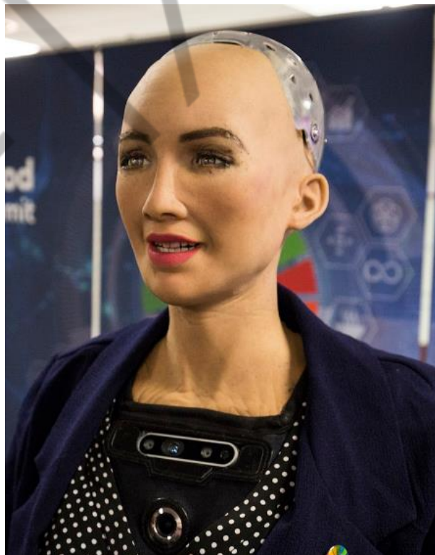
Figura 1.1 – Sophia, um dos robôs mais famosos dotados de Inteligência Artificial e a primeira a receber a cidadania de um país (Arábia Saudita)

Permitir que os sistemas aprendam com a zeta quantidade de dados disponíveis e forneçam análises e previsões concretas passou a ser indispensável ao mercado financeiro, no planejamento estratégico das empresas, nos sistemas de logísticas, nas ações de marketing, no tato e sentimento com o cliente, em um mundo mais sustentável, na educação, na criação de cidades inteligentes, na prevenção e cura de doenças, na Robótica e em todo e qualquer segmento da humanidade.