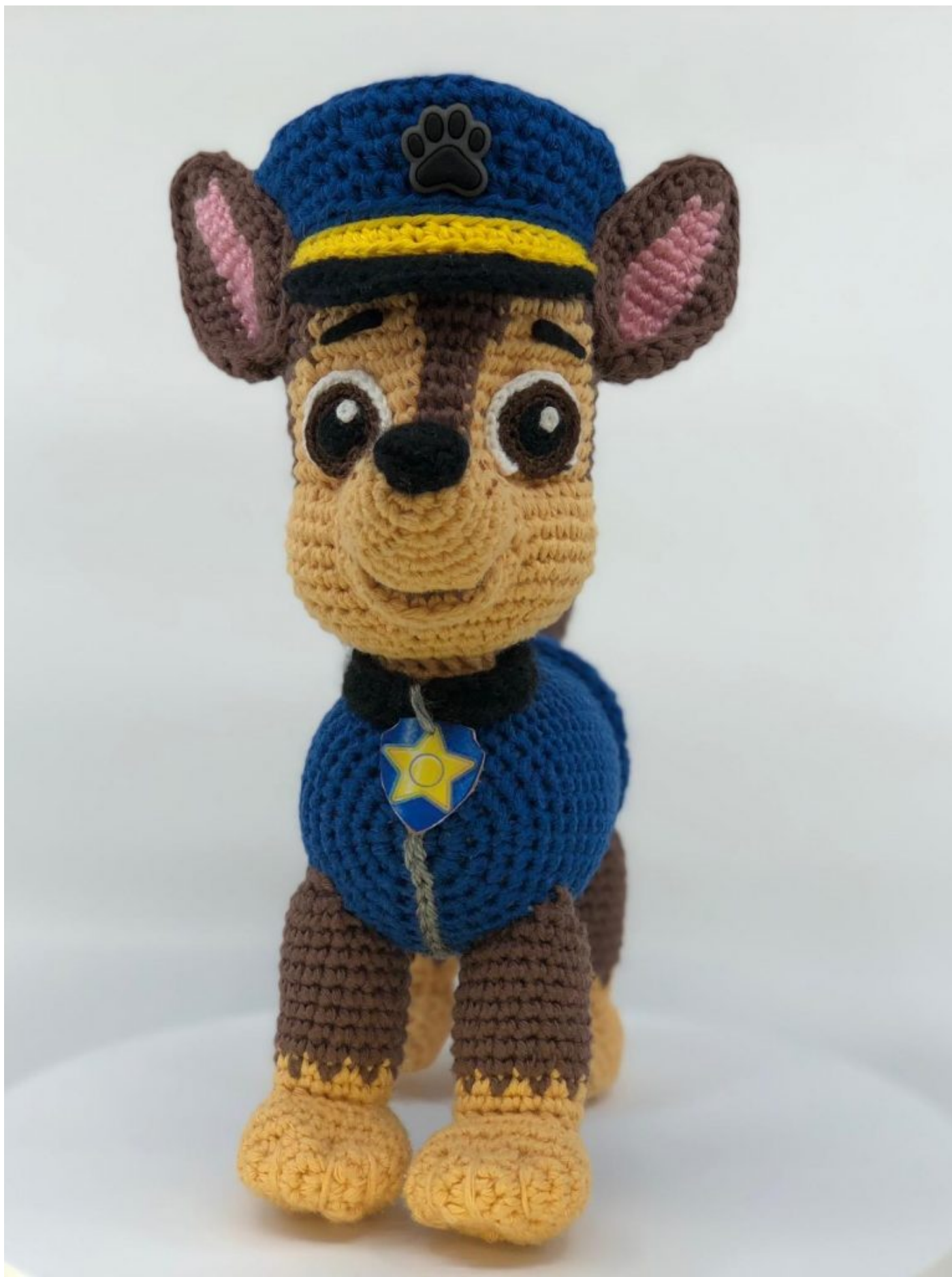
Chase patrulha canina