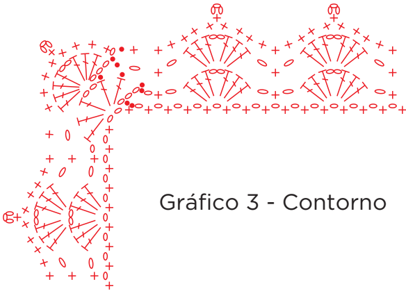
Gráfico 3 - Contorno