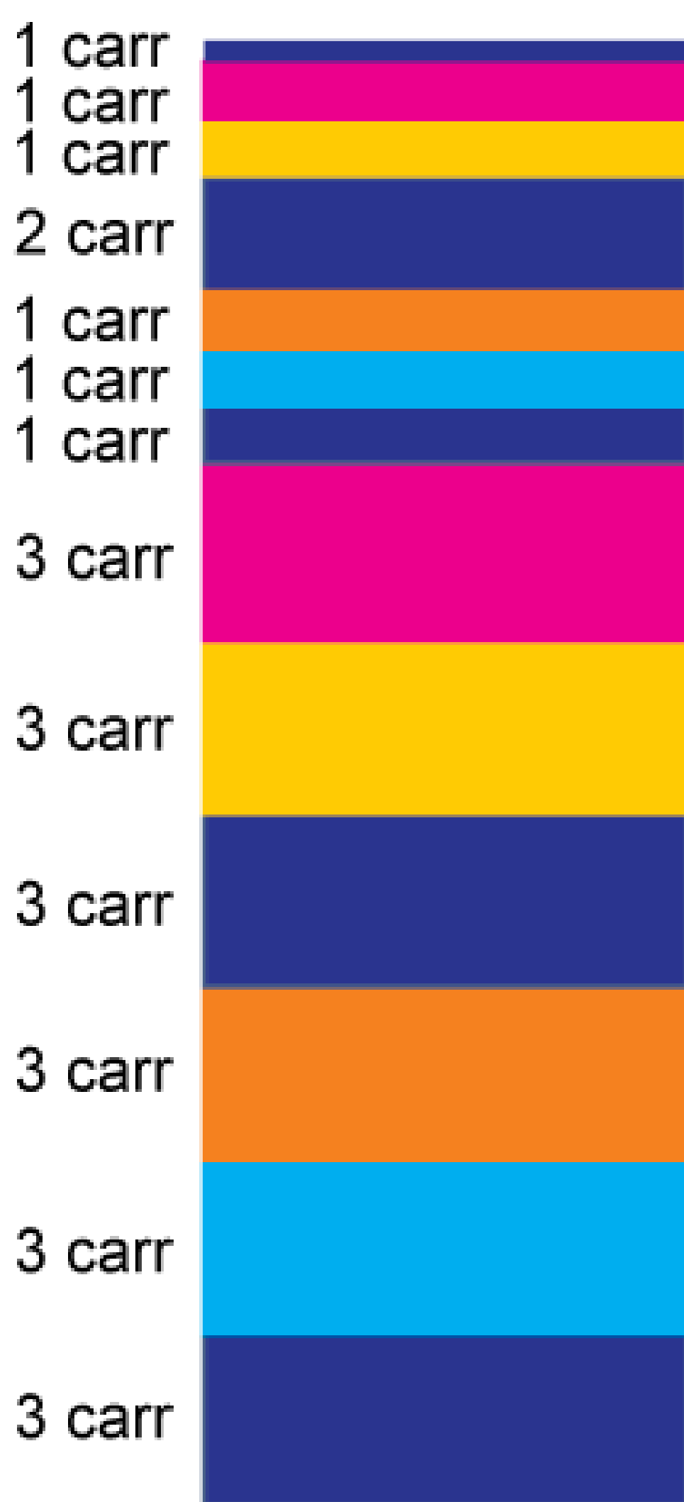
Esquema de cores e carreiras