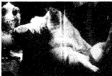
Figura 1. “Ursula Hamdress”, da Playboar . Esse material foi reproduzido em The Beast: The Magazine That Bites Back , 10 (verão de 1981), pp. 18-19. O animal foi fotografado por Jim Mason, defensor dos animais, na Feira Estadual de Iowa, onde o mostraram como uma “pinup”.

Eu afirmo que Ursula Hamdress e as mulheres estupradas que Heidnik matou e serviu às suas prisioneiras estão ligadas por uma superposição de imagens culturais da violência sexual contra as mulheres e da fragmentação e desmembramento da natureza e do corpo na cultura ocidental. 3 Especialmente interessantes são as representações culturais do retalhamento de animais, porque o consumo de carne é o meio mais frequente pelo qual interagimos com os animais. O retalhamento é o ato facilitador por excelência para o consumo da carne. Executa um literal desmembramento dos animais enquanto proclama nossa separação intelectual e emocional em relação ao desejo deles de viver. O retalhamento como paradigma fornece também um acesso para compreendermos a razão pela qual existe uma profusão de imagens culturais sobrepostas.