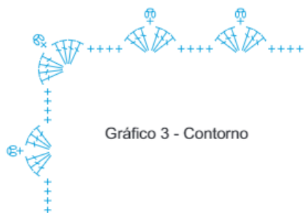
Gráfico 3 - Contorno