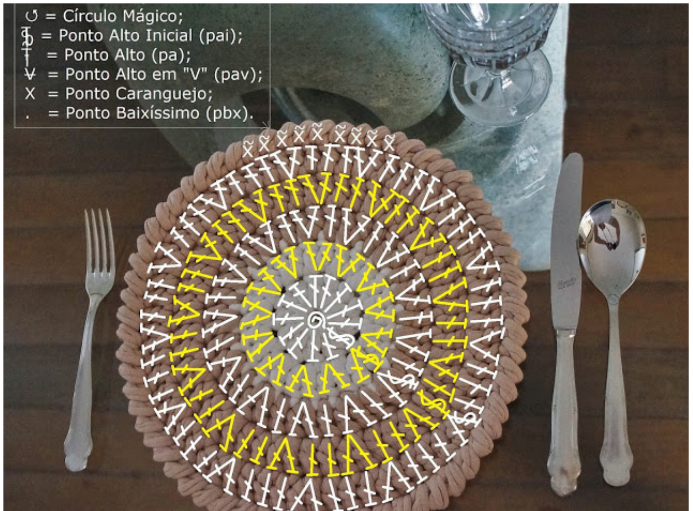
GRÁFICO COM LEGENDA