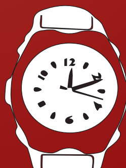
Relógio 350g à 400g me baseio em Invicta, pois são os mais pesados.