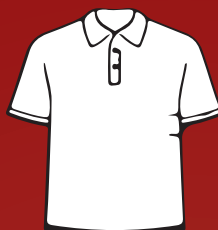
Camisa Polo 250g