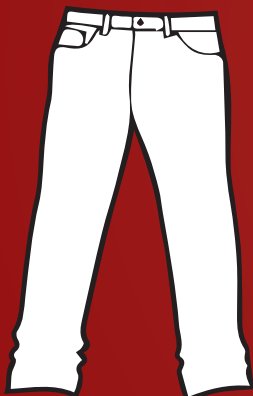
Calça Jeans 460g à 500g