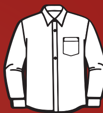
Camisa Social 300g à 350g