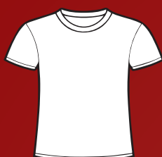
Camiseta 180g à 200g