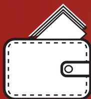
Carteira 100 à 150g dependendo se é masculina ou feminina