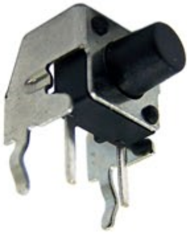
Chave tátil 90°

O defeito estava no capacitor de disco smd, porém as vezes o defeito pode estar também na chave tátil, que é o botão que utilizamos pra acionar o aparelho no automático. Sempre que você pegar uma placa com esse sintoma, substitua a chave.