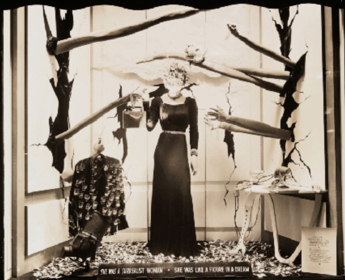
BONWIT TELLER. NEW YORK.