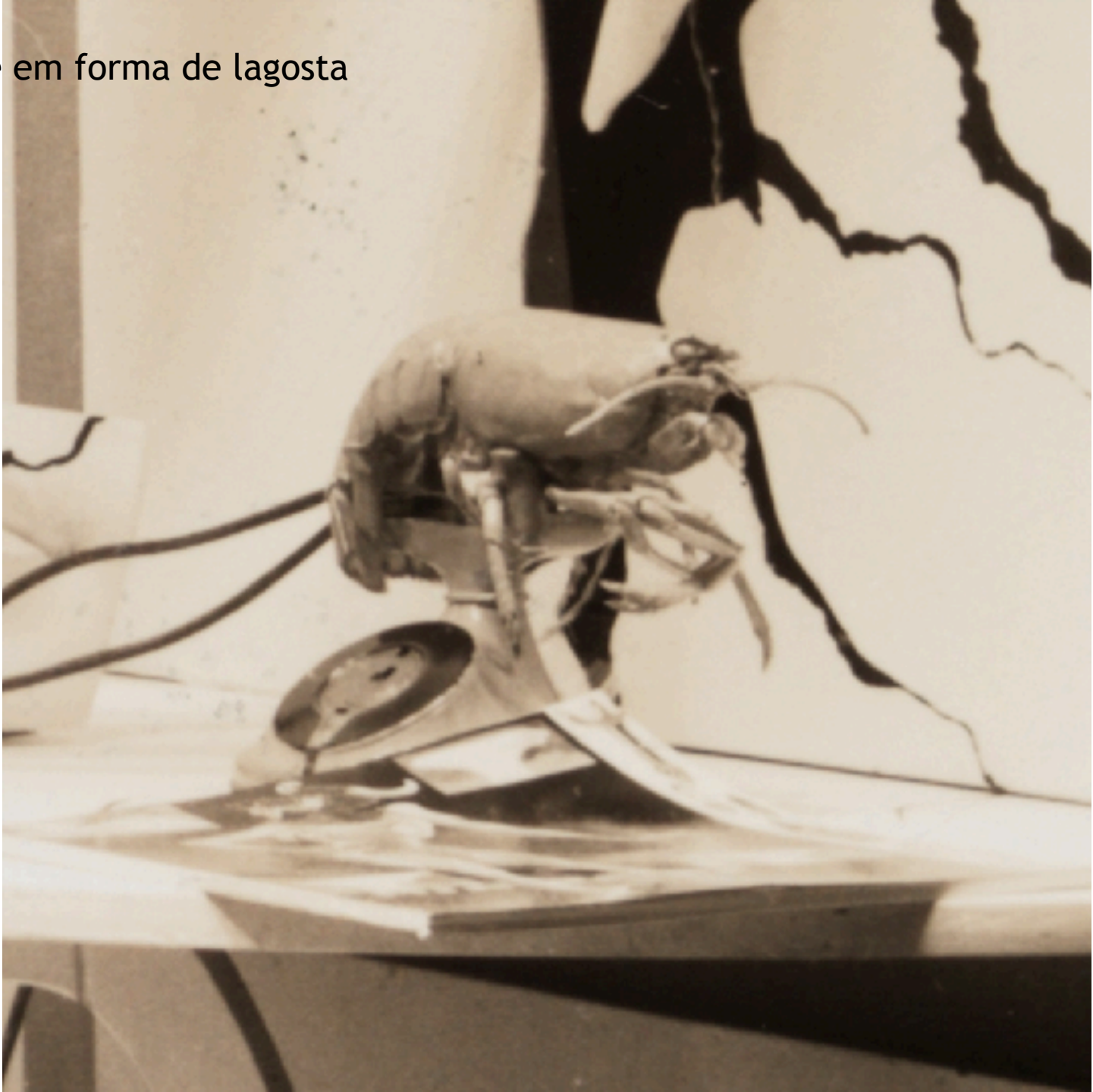
Telefone em forma de lagosta