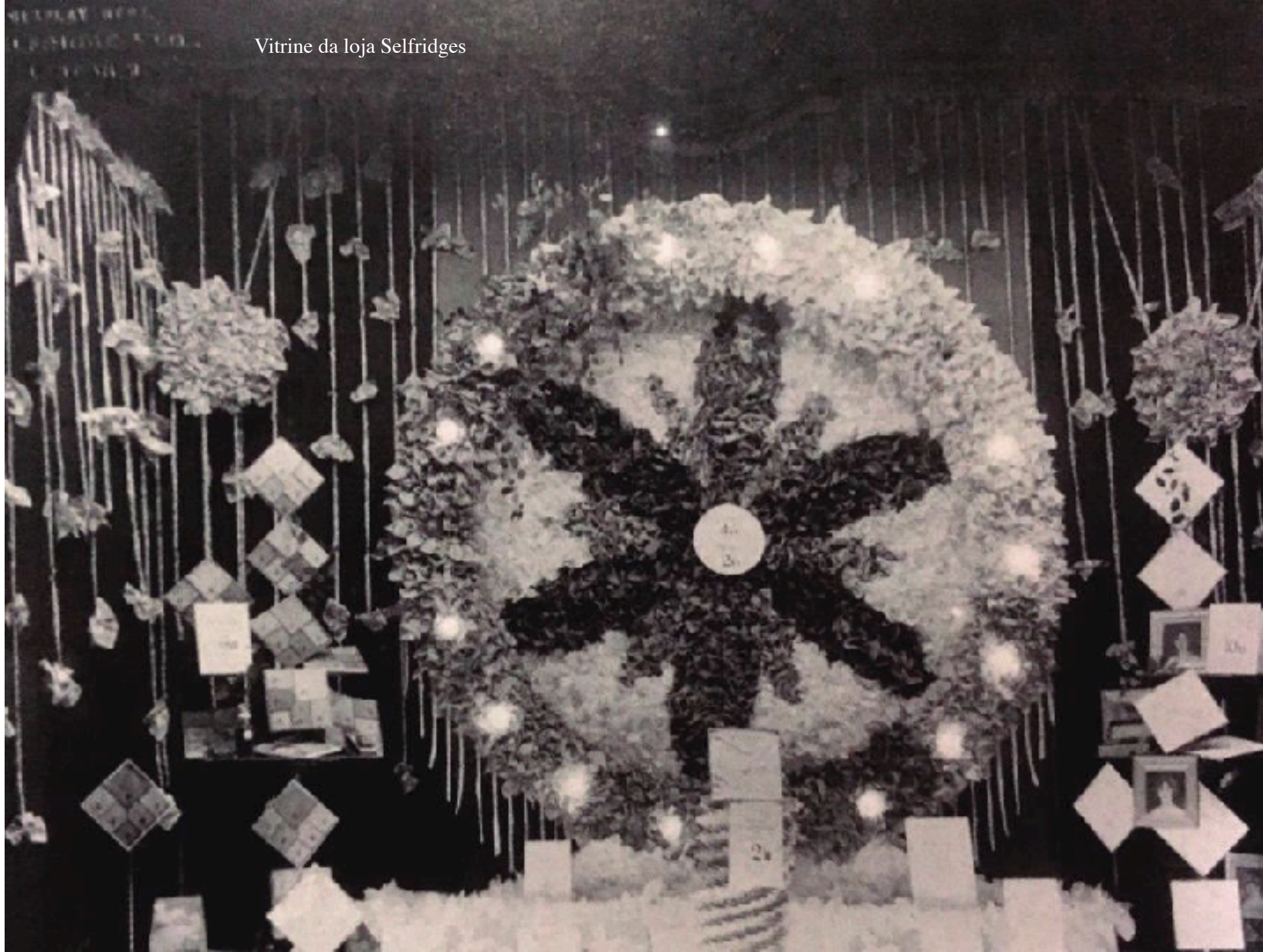
Vitrine da loja Selfridges