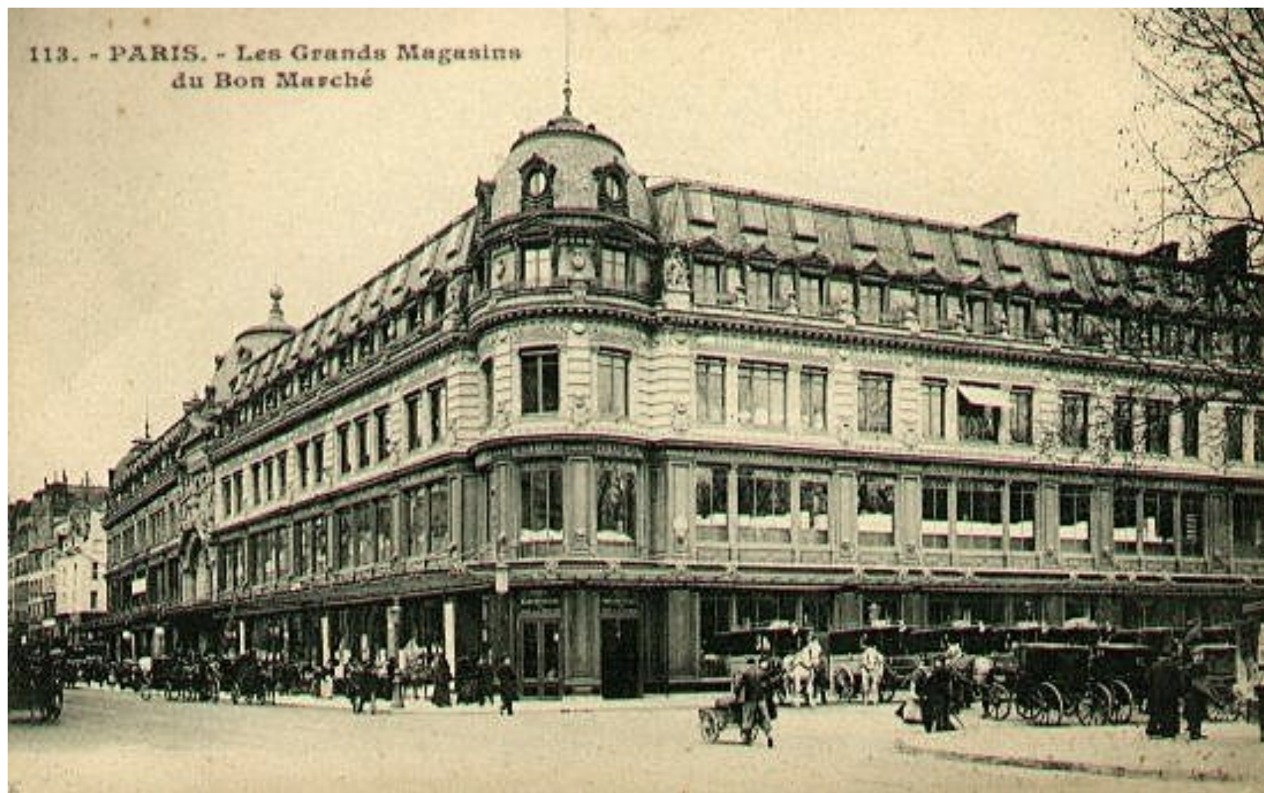
113. - PARIS. - Les Grands Magasins du Bon Marché