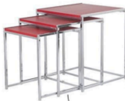
Conjunto de mesa Ninho Liz