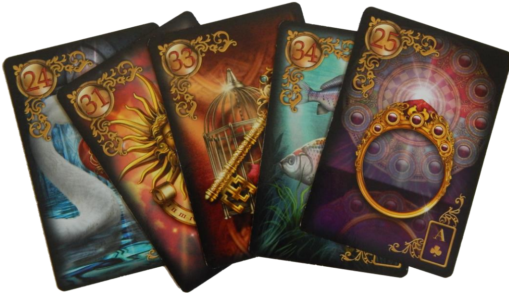
Douglas Colle / Deck: Gilded Lenormand)