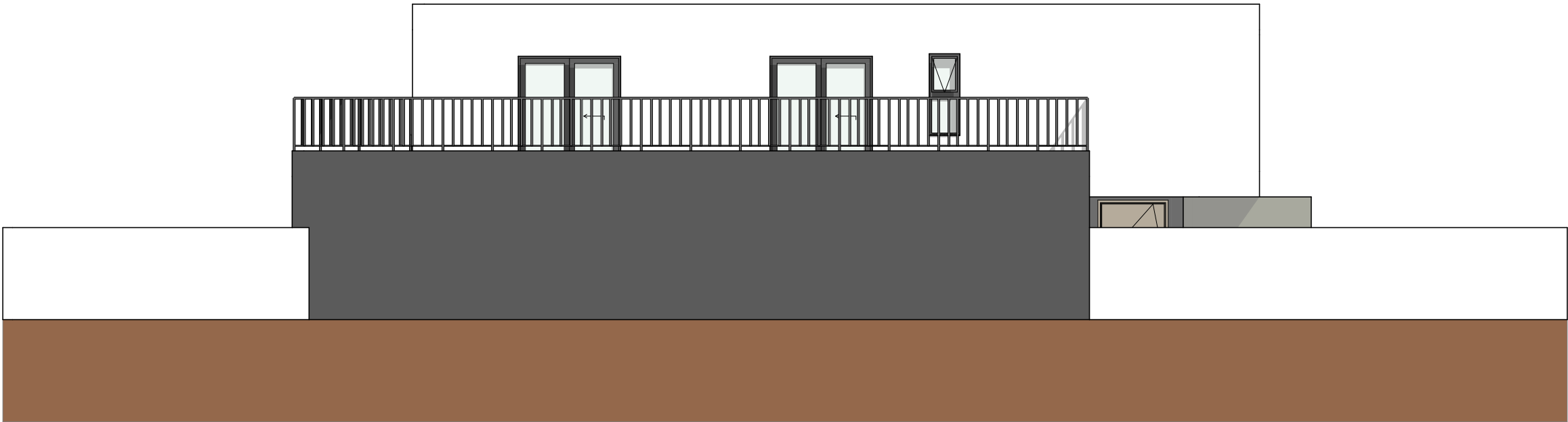
LESTE ESCALA: 1:100

5.67 COBERTURA 2.80 2º PAVIMENTO 0.00 TÉRREO