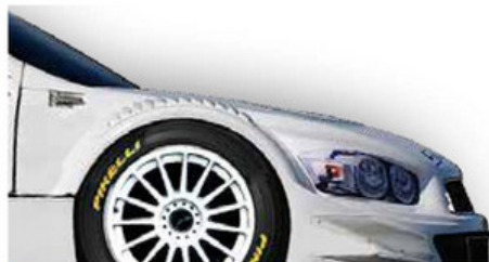
12 CONHEÇA O CARRO DA STOCK

Sempre atenta à segurança, Stock Car começa a preparar novos médicos para atuar nos autódromos.