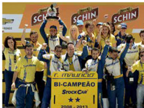
42 RELEMBRE A TEMPORADA 2013