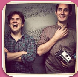
Mike Krieger e Kevin Systrom

A história também começou em março de 2010 quando o brasileiro Mike Krieger e Kevin Systrom resolveram fundar a empresa Burbn para desenvolver um serviço de check-in e fotografia móvel.