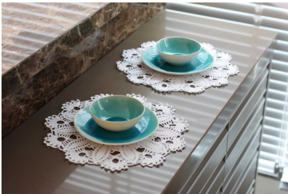
Sousplat Anne Branco