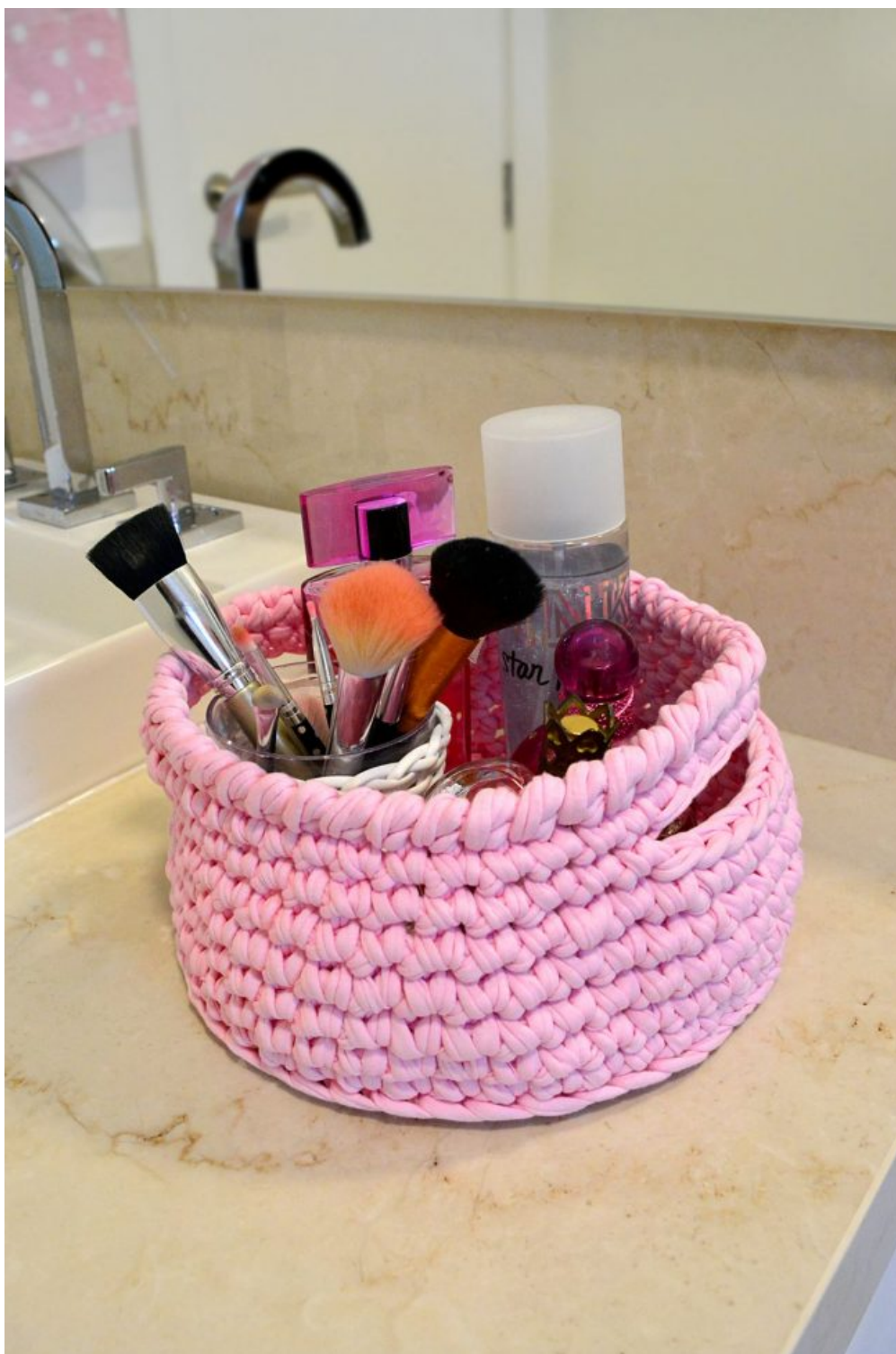
Cesto com Alça