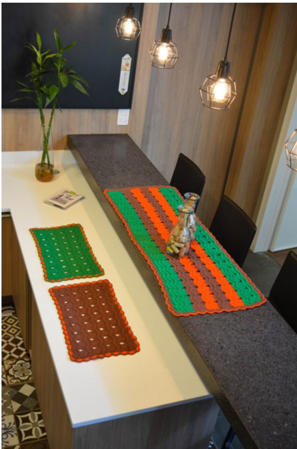
Trilho + Sousplat Duna Verde Laranja e Marrom