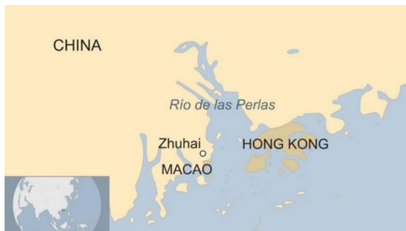
Localização de Hong Kong. Elaboração: G1.

Macau, ex-colônia de Portugal, também detém o status de Região Administrativa Especial da China.