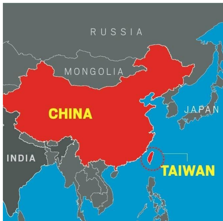
Localização da ilha de Taiwan

Outro foco de divergência é sobre a questão da ilha de Taiwan , que a China considera uma província rebelde e quer reintegrar ao país.