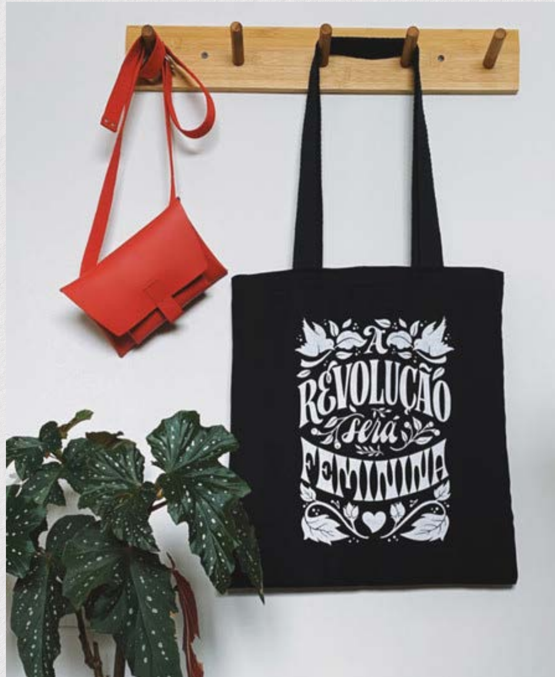
Ecobag, Cris Pagnoncelli