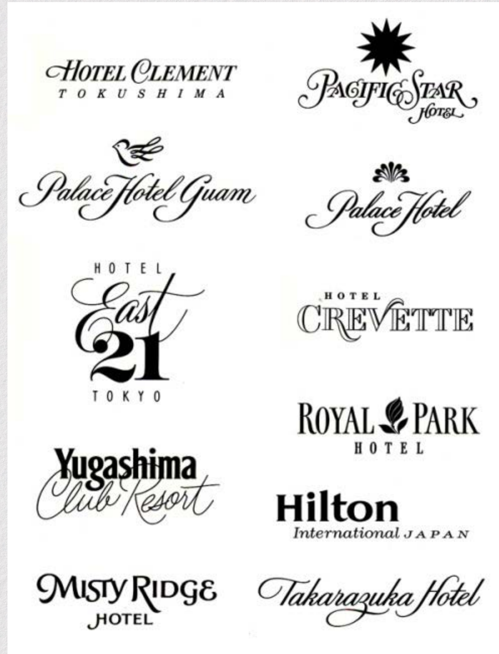
Logotipos de Hoteis, Doyald Young