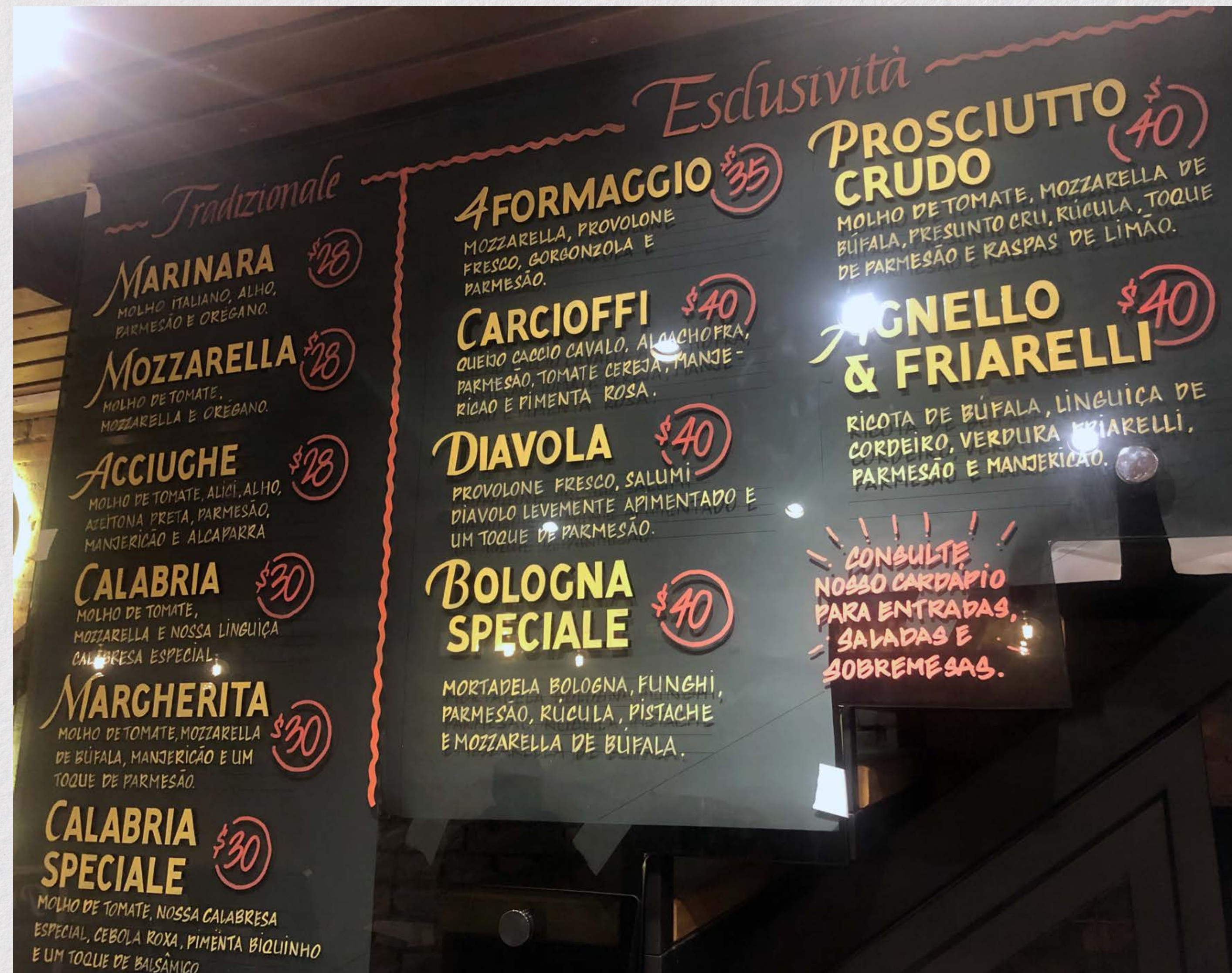
Cardápio pintado Estúdio Itálico