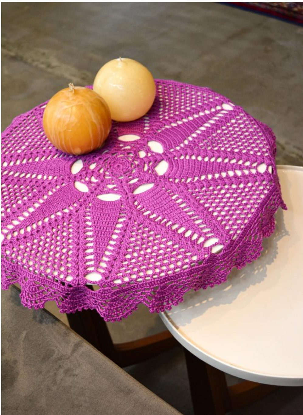
Toalha de Mesa Aurora