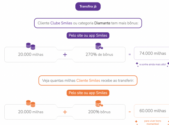
Exemplo de bonificação em transferência de milhas

Voltar a acumular milhas vai ser simples: Cliente Smiles reativa milhas e recebe 150% de bônus , enquanto cliente Clube Smiles ou categoria Diamante reativa e garante 185% de bônus .