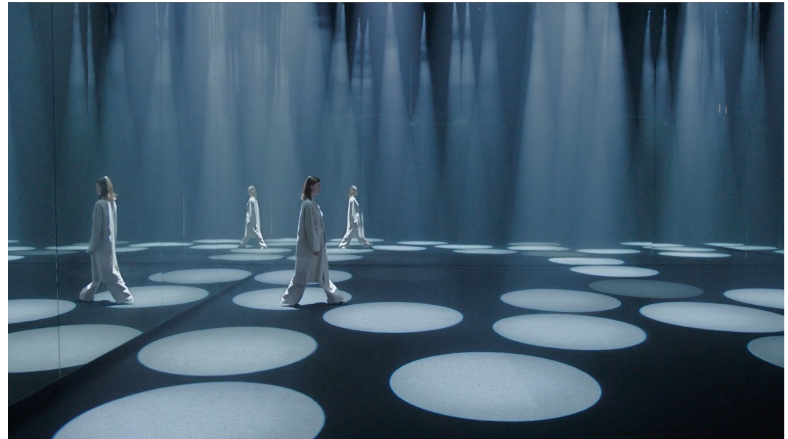
‘Forest of Light’ – COS x Sou Fujimoto SALONE DEL MOBILE 2016