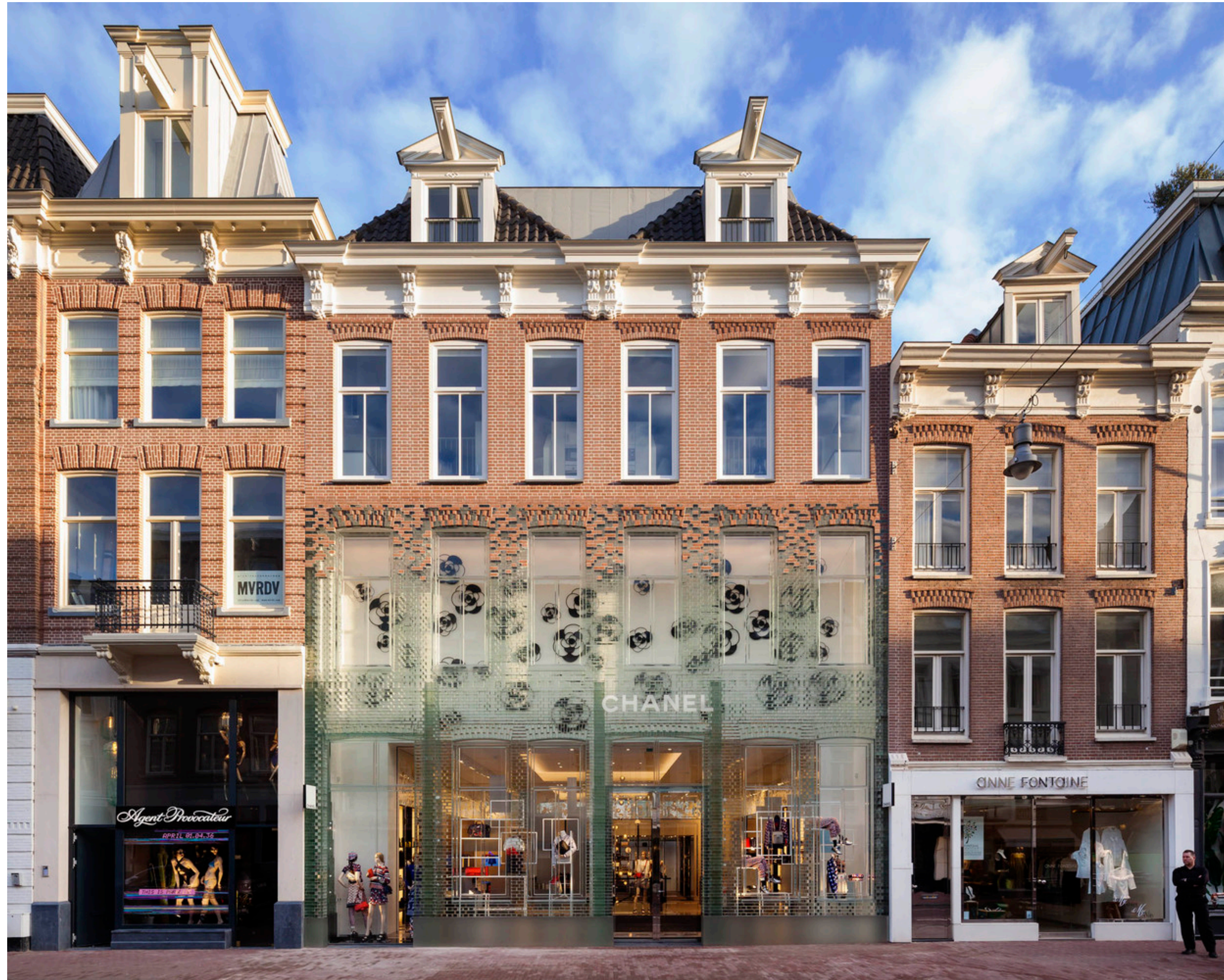
Chanel Store, MVRDV