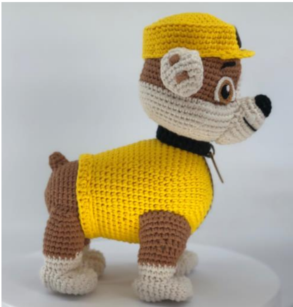
Figuras dos símbolos dos colarinhos.