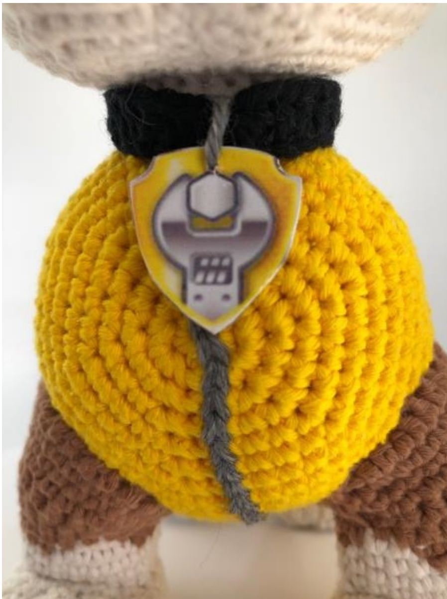
Zíper bordado com fio de cor cinza