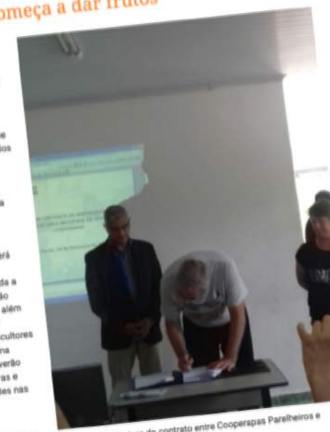
Evento de Assinatura do contrato entre Cooperapap Parelheiros e Secretaria Municipal de Educação

Agora é lutar para que o projeto seja implementado em toda a rede de ensino de São Paulo. O Deputado Federal já pensando na extensão nacional do projeto.