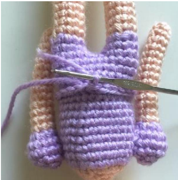
R1: juntou-se e completar. (24 pts)