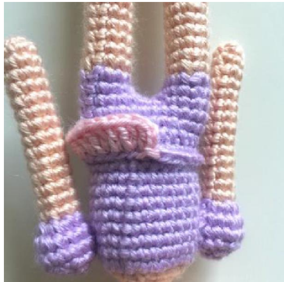
R2 (in BLO): Ch 3, (pa, pa-Aum) x 12 apenas na alça trás *Junte. (36 pts)