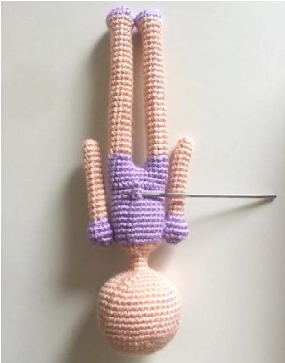
Inserindo agulha na parte traseira da boneca, entre R9-R10 do vestido roxo.