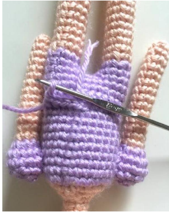
R1: Ch 1, pb ao redor...