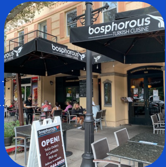
Universal City Walk

108 S Park Ave, Winter Park, FL 32789, EUA