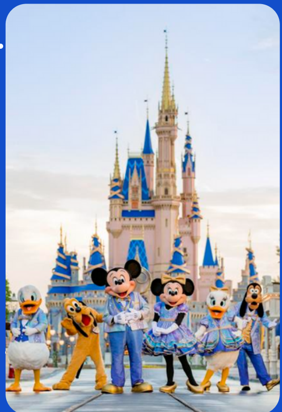
• Magic Kingdom

É neste local que ocorrem as paradas durante o dia e o show de fogos a noite.