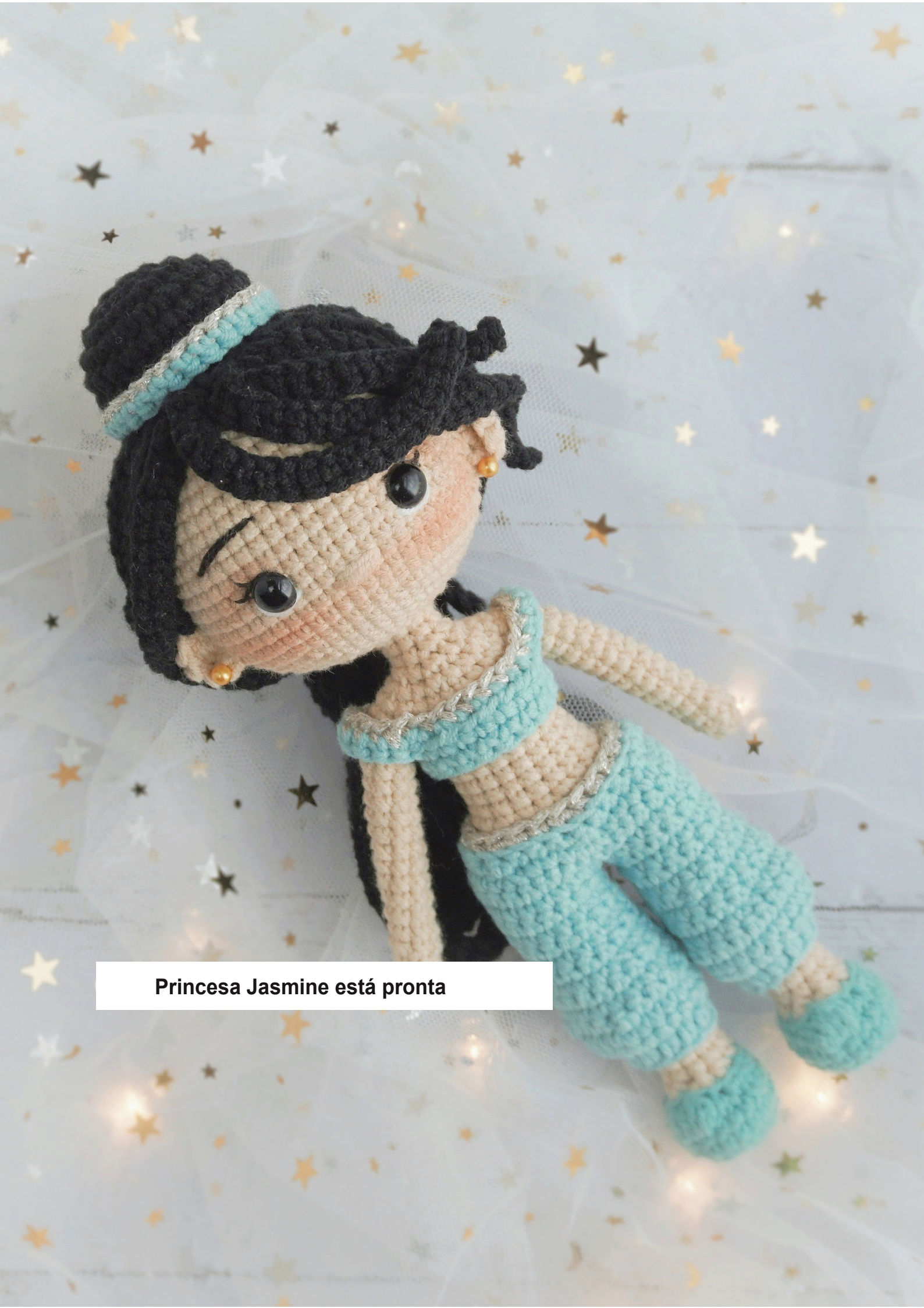
Princesa Jasmine está pronta