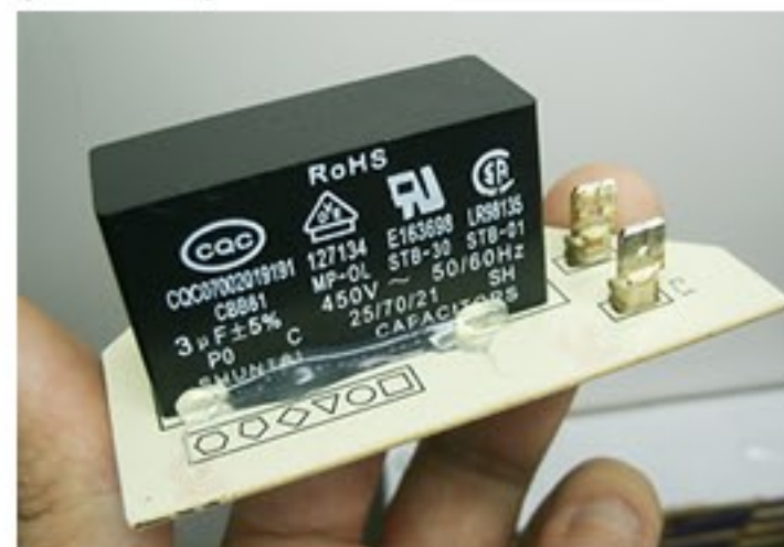
(Capacitor do motor ventilador)

O capacitor de ventilação fica em uma placa separada: