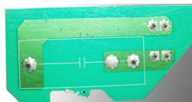
(Vista da placa por baixo)