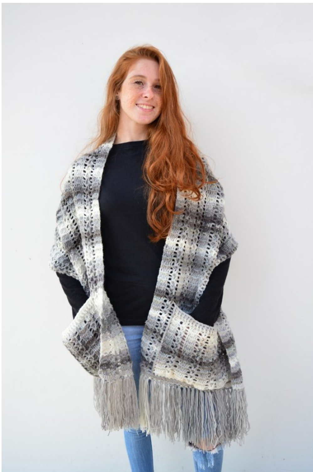
Cachecol com Bolso Grega