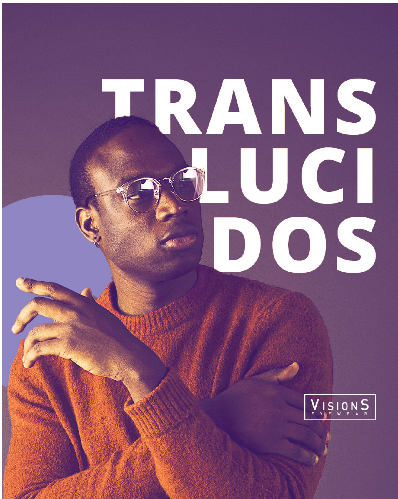
Photo filter (Filtro de Fotos). Esse ajuste adiciona um filtro de cor por cima da sua imagem, como se a fotografia fosse tirada com uma lente colorida. Você pode escolher de uma lista de cores pré estabelecidas ou definir exatamente a sua e o quanto de densidade essa camada vai ter. É possível ainda preservar a luminosidade ou fazer com o filtro interfira na iluminação da imagem.