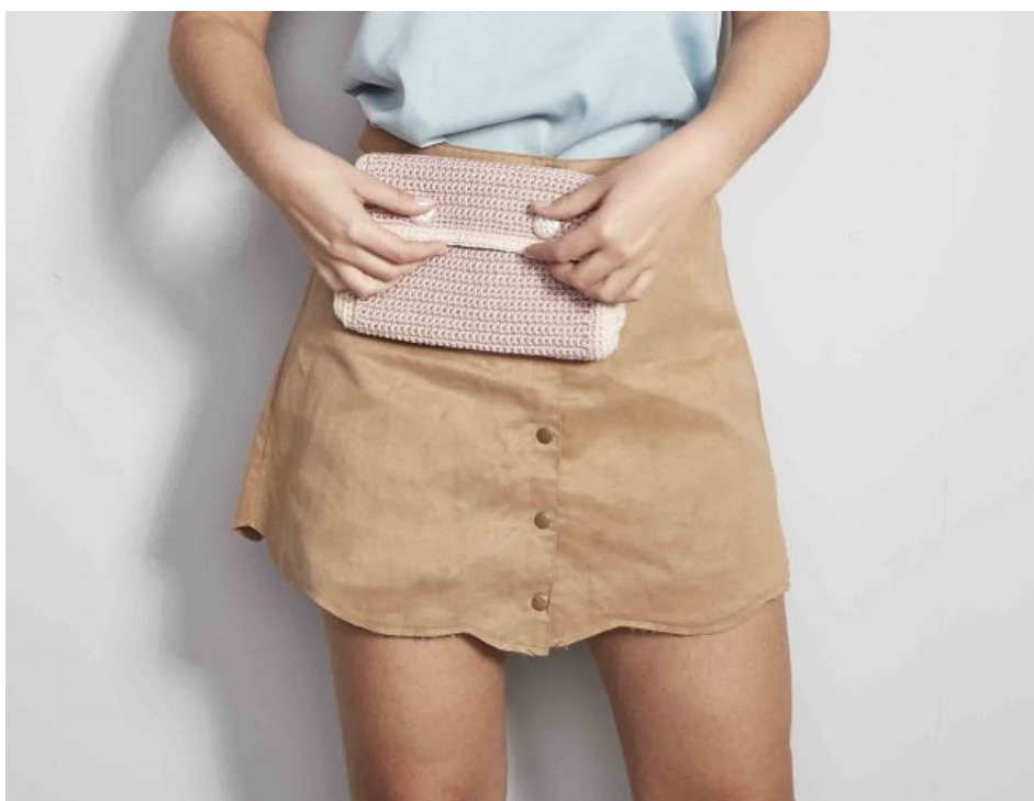
Pochete Camafeu Rosado